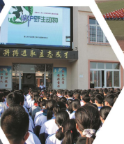
2019年承担区市级运动会团体操展演