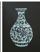
校园文化品牌 蛋壳拼贴画