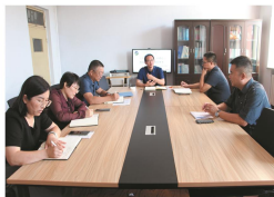
团结务实的领导班子