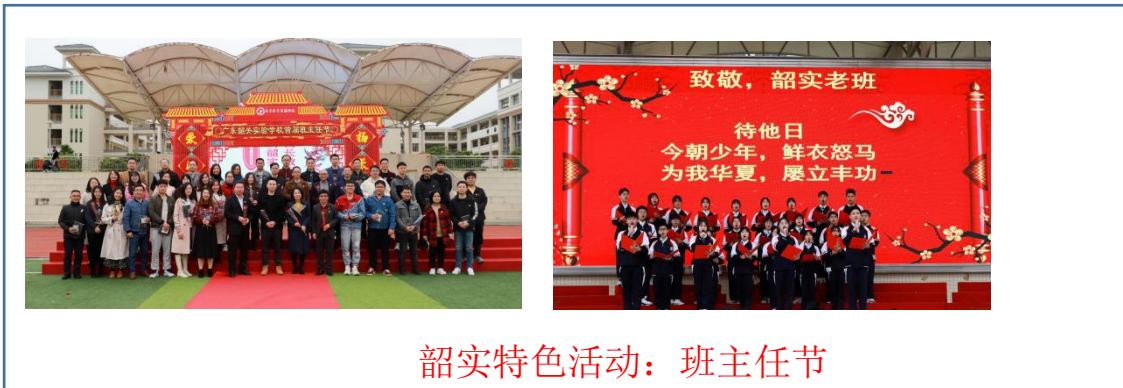
韶实特色活动：班主任节

为丰富校园生活，学校每年举办多类型的特色活动，如班主任节、元旦晚会、校动会、校外远足、篮球赛、“校园十大歌手”、拔河比赛、英语配音活动、社团艺术节等。